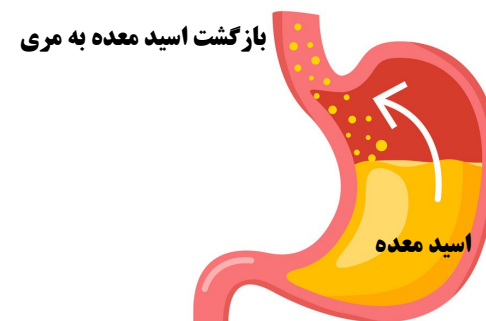
بازگشت اسید معده به مری را مشاهده می کنید

برگشت محتویات معده به مری یا حلق را ریفلاکس معده به مری گویند.